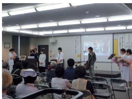
(*4) 緩和ケア週間の様子