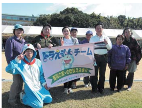
(*2) リレーフォーライフ（ドラえもんチーム） がんを負けない社会をつくることを 呼びかけながら交代で夜通し歩くイベント。