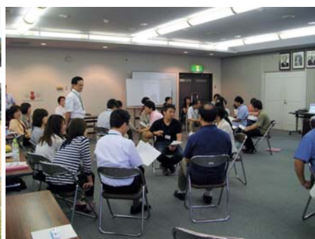
(*3) 緩和ケア講習会グループ討議