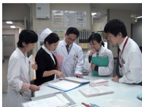
(*1) ラウンド風景 ひとり通り患者さんの元へ行き、診て回ること。